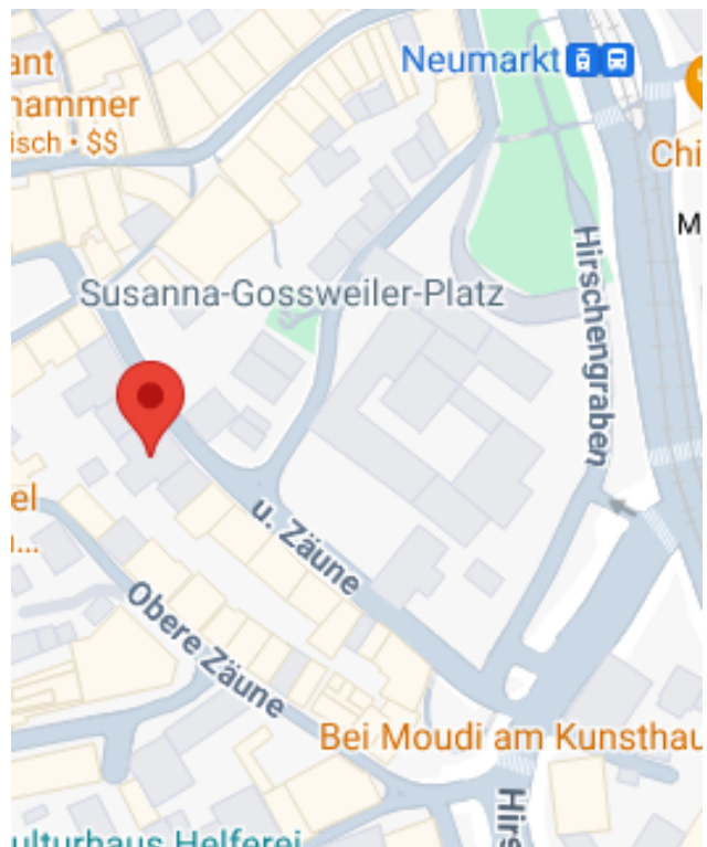
Untere Zäune 19

Eine gemeinsame Tagung von Anthroposophische Gesellschaft Schweiz, Michael-Zweig Zürich Die Christengemeinschaft, Gemeinde Zürich